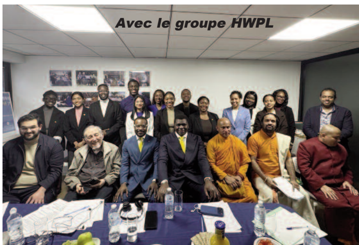
Avec le groupe HWPL

Mais vu mon âge je ne peux plus me déplacer comme je voudrais, ce qui m'oblige à vivre au quotidien le dialogue inter-religieux depuis mon EHPAD même. Je continue de communiquer par WhatsApp avec nombre d'amis musulmans et chrétiens en Afrique. A l'occasion de l'Aïd el Fitr, la fête de fin du Ramadan, je n'oublie jamais d'envoyer mes vœux à tous les responsables musulmans que je connais. Et puis, sur place, parmi le personnel de la maison plusieurs d'entre eux sont de religion musulmane, ce qui me permet de poursuivre ma passion du dialogue, pilier de mon activité missionnaire tout au long de ma vie ; car comment rester indifférent à la lecture de cet extrait