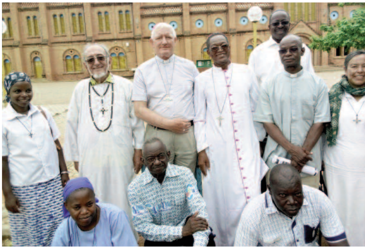
Comité diocésain de Ouagadougou allant à la prière musulmane de fin de ramadan.