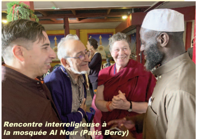
Rencontre interreligieuse à la mosquée Al Nour (Paris Bercy)