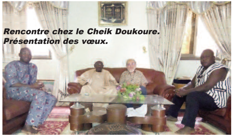
Rencontre chez le Cheik Doukoure. Présentation des vœux.

C'est aussi par le CIEUX (cf. 1er paragraphe) que j'ai pu entrer en contact avec les musulmans de la tendance Ahmadiya lors d'une intervention dans un forum pour la paix et aussi dans le cadre d'un Iftar