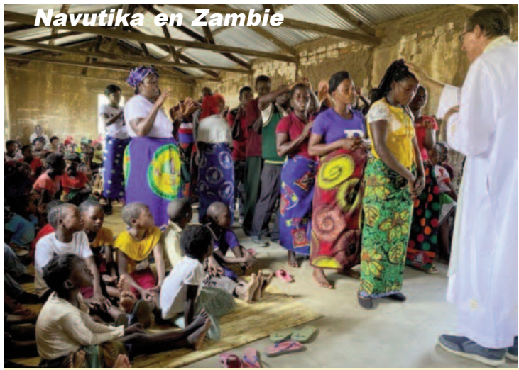
Navutika en Zambie

été donnée à l'invitation de l'évêque de Meki en Ethiopie pour s'occuper d'un Centre pastoral. Cela renforcera la présence des Pères Blancs dans ce pays qui a