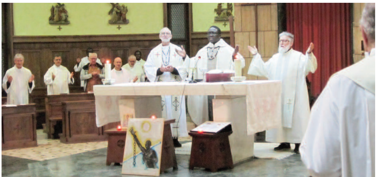
Photo ci-contre : Messe d'Action de grâces pour sa libération. Ha-Jo est à gauche du Supérieur général qui préside de la célébration.

« Ils se disent djihadistes et en sont très fiers. Ils passent leur journée à apprendre le Coran par cœur, démonter et remonter leur kalachnikov, à écouter des sermons et des chants en arabe. »