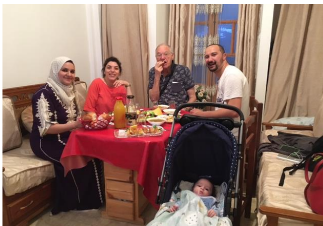
Repas partagé avec un jeune couple sourds avec leur bébé, anciens élèves et notre assistante sociale de l'association R&D

A près 50 années de présence en Algérie et à la lumière de l'actualité locale et mondiale aujourd'hui, je dirais : Être missionnaire d'Afrique en pays musulman semble tout à fait d'actualité et correspond à notre vocation initiale telle que notre fondateur l'avait voulue. Oui, c'est pour moi une nécessité urgente ! Mais comment donner un sens pratique sur le terrain, là où nous nous trouvons ? En laissant l'Esprit nous guider et en écoutant le bienheureux Pierre Claverie qui disait : « Notre vocation est d'Être présent sur les lignes de fracture de la société humaine ». En effet, plus que jamais, nous devons être là, où la parole libératrice de l'Évangile n'est pas connue ou entendue !