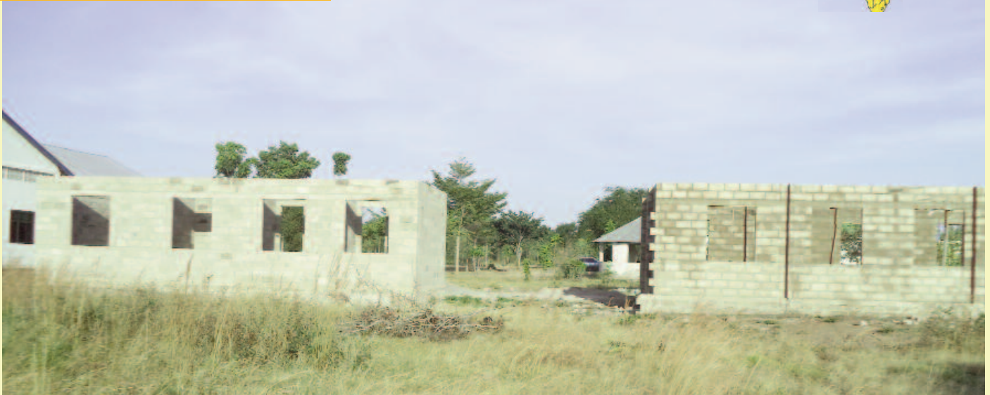
La Fédération des AAPB a contribué à la construction de deux salles dans une paroisse de Tanzanie.